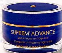
„Suprem'Advance Anti-Aging Night Care“ von Jeanne Piaubert, ca. 202 Euro

Die Australierin (45) ist eines der Gesichter des US-Beauty-Riesen Revlon und hat auch eine eigene Kosmetiklinie. Sie weiß also, wie's geht!