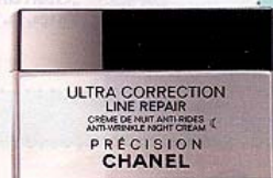
„Ultra Correction Line Repair“-Nachtpflege von Chanel, ca. 100 Euro

So wird eine Gewebeverhärtung und letztlich auch die Faltenbildung verhindert. Die Fibroblasten in der Haut können wieder geschmeidige Kollagenfasern bilden – die Haut wird glatt und praller