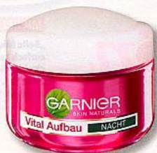
„Vital Aufbau Nacht“ von Garnier, ca. 10 Euro